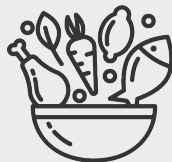
Ăn đa dạng nhiều loại thực phẩm