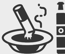
Không sử dụng các sản phẩm thuốc lá