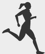
Tập vận động

Có nhiều việc chúng ta có thể làm để giảm nguy cơ này. Phần lớn bệnh tim có thể phòng ngừa được.