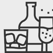
Hạn chế uống rượu