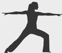
Quản lý căng thẳng