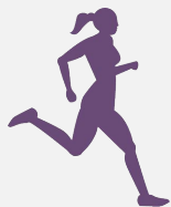
Tập vận động

Có nhiều việc chúng ta có thể làm để giảm nguy cơ này. Phần lớn bệnh tim có thể phòng ngừa được.