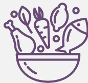
Ăn đa dạng nhiều loại thực phẩm