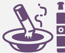
Không sử dụng các sản phẩm thuốc lá