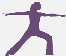
Quản lý căng thẳng