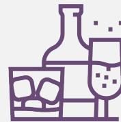
Hạn chế uống rượu